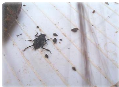
在溪澗旁找到的蜻蜓若蟲