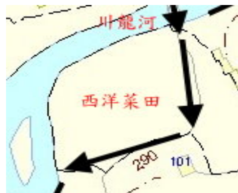
此段路有最多蜻蜓出沒