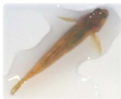
捕食蜻蜓若蟲的蝦虎魚