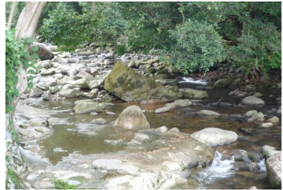
川龍河的東面上游

川龍村是出產西洋菜的勝地，在小巴士站常有村民擺賣。端記茶樓最出名的西洋菜也是由旁邊的西洋菜田即摘即煮的，味道十分甘甜。在回程時可以買些西洋菜回家裏。