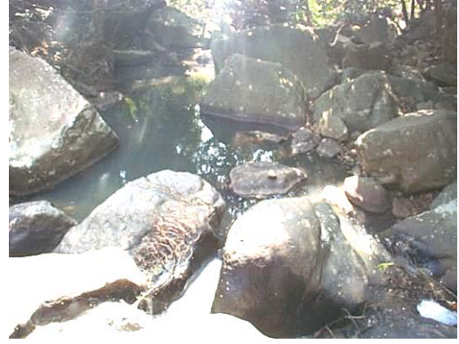
累了可以坐在石上休息

一家人可以用捕蟲網捕捉蜻蜓或豆娘，用魚網捕捉淡水魚。但家長切記要教導小孩愛護生物，把牠們放回原位。然後，沿小徑返回西洋菜田，往川龍河的東面上游觀察，在那裡還有別的蜻蜓和豆娘出沒哩。